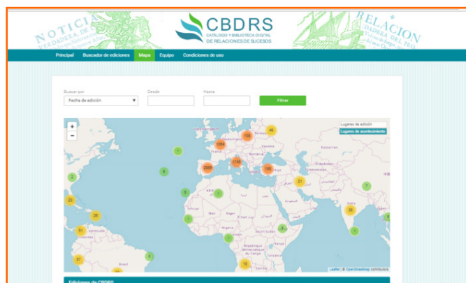
Figura 3. Geolocalización de lugares de acontecimiento

La cartografía de base es de Open Street Map, 3 que tiene una licencia de uso libre.