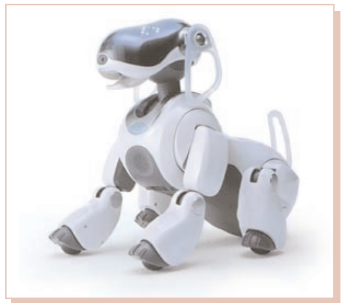
Imagen 5. Robot Aibo, de Sony.

El objeto se convierte en otros casos en receptor de las necesidades afectivas del individuo. Sherry Turkle define como «artefactos relacionales» una serie de productos que han ido saliendo al mercado en los últimos años y que se presentan como seres sociales con los que entablar una relación. Turkle ha desarrollado un estudio en el que ha preguntado a los usuarios de este tipo de objetos acerca de sus sentimientos hacia ellos. Dos de los aspectos más destacados han sido la posibilidad de establecer una relación afectiva «segura» (dado que el robot no realizará acciones que dañen al usuario, ni le abandonará) y el hecho de que el robot no va a morir nunca. Es lógico prever que el desarrollo de este tipo de robots va a proseguir en el futuro y que pronto la relación con seres artificiales, afectiva o no, será común. Lo que se plantea entonces es qué tipo de relación resulta deseable.