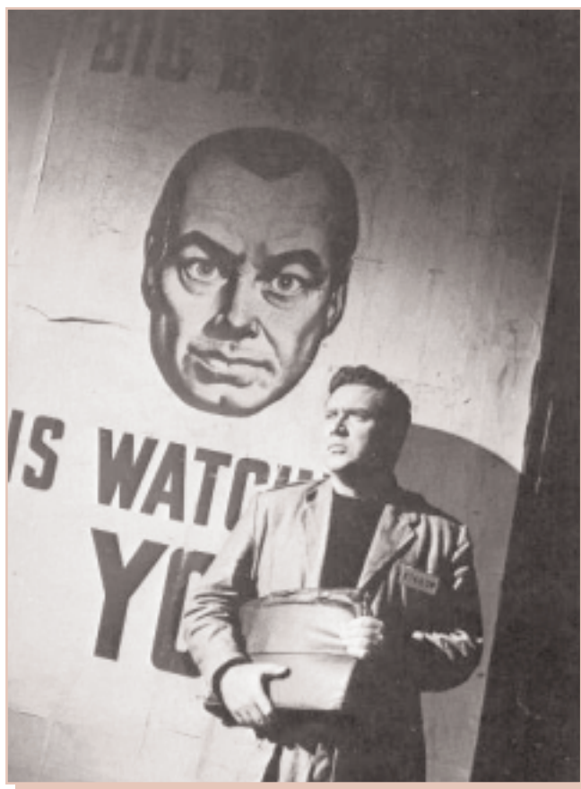
Imagen 1. Edmon O'Brien interpretando a Winston Smith en la película 1984 (1956) de Michael Anderson.

En esta misma época se sitúa otra predicción de futuro, expresada en este caso desde el ámbito científico. En 1945, el científico e ingeniero Vannevar Bush escribió un artículo para la revista Atlantic Monthly titulado «As we may think», en el que describía un artilugio que denominó Memex (contracción de memory extender , «expansor de memoria»), y que consistía en un gran escritorio dotado de pantallas translúcidas en las que podían proyectarse a voluntad textos e imágenes de un archivo en microfilme que se conservaría en el interior del aparato. Las ideas de Bush prefiguraron de forma conceptual lo que cuarenta años más tarde sería el ordenador personal e influyeron directamente en Douglas Engelbart, quien inventó el ratón y fue pionero en el desarrollo de la interfaz gráfica de usuario y el hipertexto.