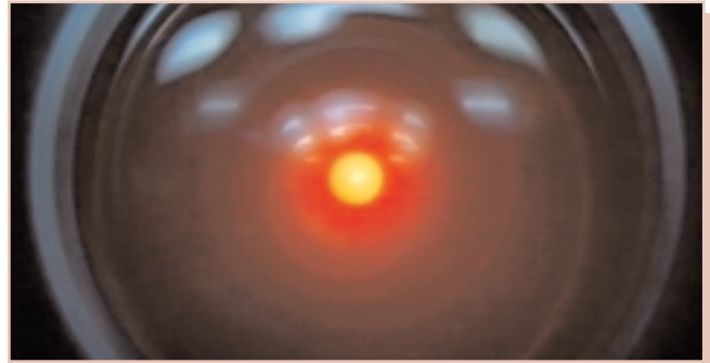
Imagen 3. Detalle del «ojo» de HAL 9000, de la película 2001: una odisea del espacio (1968), de Stanley Kubrick.

La década de 1970 ve el nacimiento de las tecnologías que darán forma a la actual sociedad de la información. En 1969, el Departamento de Defensa de los Estados Unidos crea Advanced Research Projects Agency Network (ARPANET), la primera red de comunicación entre ordenadores basada en la transmisión de paquetes de información. El concepto inicial de dicha red partía de las ideas de J.C.R. Licklider, ingeniero del MIT, quien ya en 1962 expresó en una serie de anotaciones su concepto de una «red galáctica», que contenía la mayoría de los aspectos de lo que es hoy en día Internet.